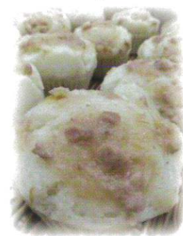
天然酵母の蒸しぱん屋 イロハ