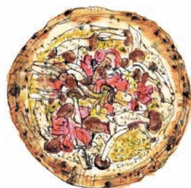
[ブリブリきのこの旨みたっぷり] フンギ 990 Funghi