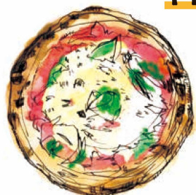
[看板ピッツァ!] マルゲリータ 780 Margherita