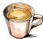
チャイ (I/H) Chai Tall Grande 600 / 660