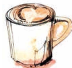
カフェラテ (I/H) Caffe latte Tall Grande 500 / 570