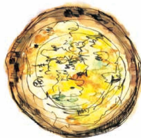
[3種のチーズ] ゴルゴンゾーラ 1040 Gorgonzola