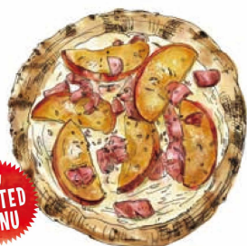
[秋リンゴのローストと燻製ベーコン] 焼きアップルとベーコン 990 Roasted Apple & Bacon