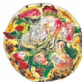
[フレッシュ野菜に生ハム!] 生ハムサラダ 1150 Prosciutto Salad