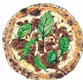
[みんな大好き! 甘辛カルビ] カルビ 990 Calvi