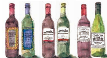
ボトルワイン(赤/白) Bottle Wine (Red / White) 2,300