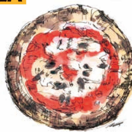
[旨味の名コンビ★] アンチョビトマト 850 Anchovy & Tomato