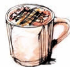
キャラメルマキアート (I/H) Caramel Macchiato Tall Grande 600 / 660