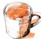
ティー (I/H) Tea Tall Grande 390 / 440