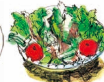
サラダ 720 Salad