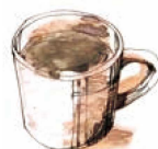
コーヒー (I/H) Coffee Tall Grande 390 / 440