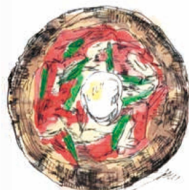
[半熟卵とアスパラ] ビスマルク 1040 Bismarck