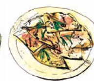
フォカッチャ 500 Focaccia