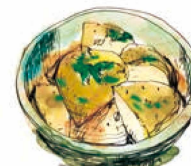
「窯焼き」ポテト 550 Potato