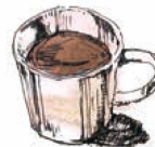
ココア (I/H) Cocoa Tall Grande 480 / 550