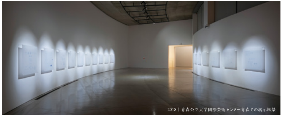
2018 | 青森公立大学国際芸術センター青森での展示風景