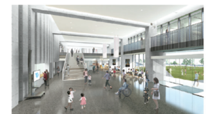
エントランスロビー(南向き)