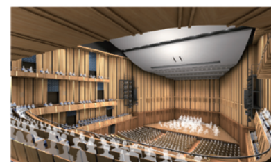
大ホール(客席より)